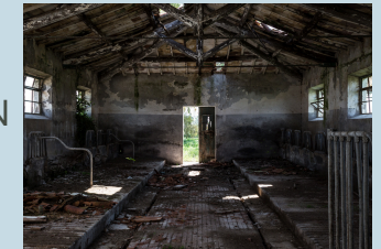
KLAUS HUTTER HUTTER-BAUPLAN

Umnutzung von Altgebäuden Ausbauen? Umbauen? Oder doch besser abreißen?