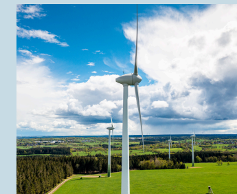
MARIA BURGHARDT INGENIEURBÜRO SING

Umnutzung von Altgebäuden Ausbauen? Umbauen? Oder doch besser abreißen?