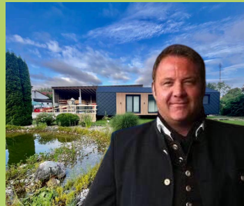
BERNHARD FORSTER FORSTER-HOMES

Tinyhouses auf Bauernhöfen - Tiny your Life! Ökologisch und ökonomisch durchdacht als Ferienhaus oder Hauptwohnsitz